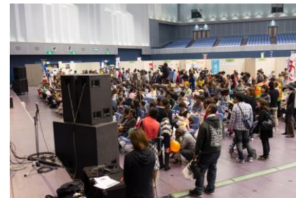
子ども遊び広場では、ボランティアの大学生のみなさんが子どもの相手をしてくださいました。約500人の参加者で終日にぎわいました。