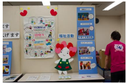
組合員理事のみなさんの力作。生協紹介コーナー。